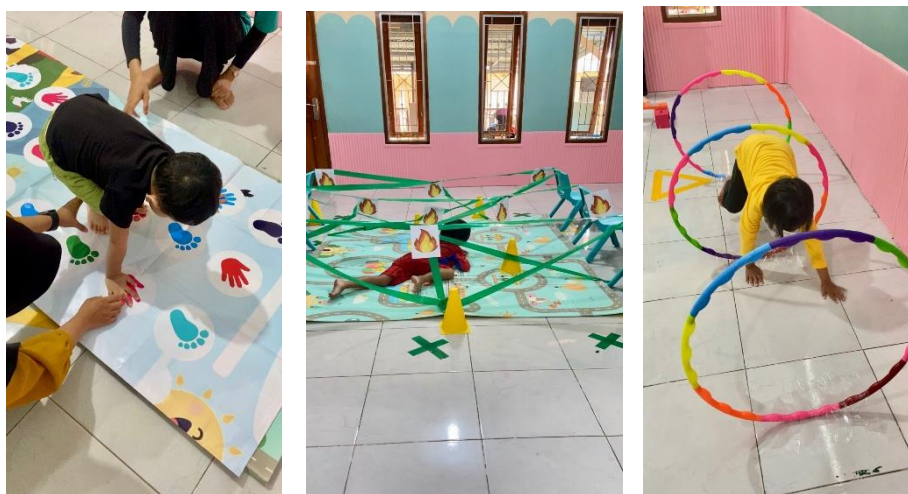
Gambar 1.1. Aktifitas Pembelajaran Peserta Didik “My Body Moves”

Selain data kuantitatif sederhana tersebut, temuan kualitatif juga memperkuat hasil penelitian ini. Selama kegiatan berlangsung, anak terlihat lebih antusias ketika pembelajaran dikombinasikan dengan lagu dan gerakan dibandingkan dengan metode konvensional. Anak juga menunjukkan kecenderungan untuk mengulang kosakata secara spontan di luar instruksi guru, yang menunjukkan adanya proses internalisasi bahasa. Meskipun hasil menunjukkan peningkatan signifikan, keterbatasan jumlah sampel dan durasi intervensi menjadi faktor yang perlu diperhatikan dalam generalisasi temuan.